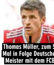
Thomas Müller, zum 5. Mal in Folge Deutscher Meister mit dem FC Bayern

Die gesamte Saison als XXL-Spielplanposter Mitte August startet die Fußball-Bundesliga in die neue Saison, aber bereits am 28.07. geht es für die 2. Liga los. Der zuverlässige Begleiter durch die Saison ist wieder das 246-seitige Bundesliga-Sonderheft von SPORT BILD: Mind. 7 Seiten ausführliche Infos zu jeder Bundesliga-Mannschaft und eine Doppelseite für alle Zweitligisten. Dazu gibt es jede Menge News zur 3. Liga sowie der Frauen-Bundesliga. Das Bundesliga-Sonderheft wird rechtzeitig zum Start der 2. Liga im Einzelhandel erscheinen. Achten Sie auf unsere weiteren Informationen.